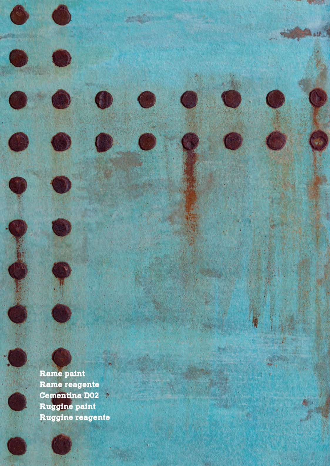
Rame paint Rame reagente Cementina D02 Ruggine paint Ruggine reagente