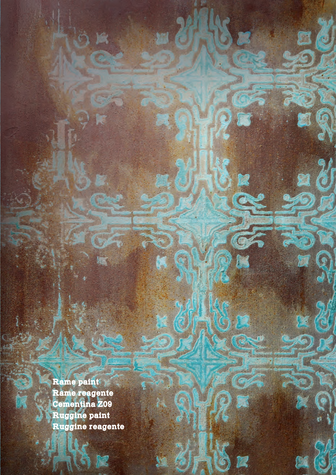
Rame paint Rame reagente Cementina Z09 Ruggine paint Ruggine reagente